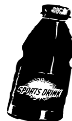
Bebidas Deportivas 20oz.