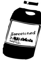
Bebidas de fruta endulzada 16oz.