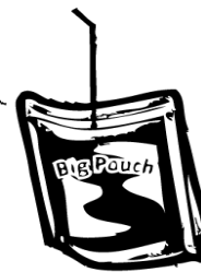
Bebidas de sabor a fruta 11.25oz.